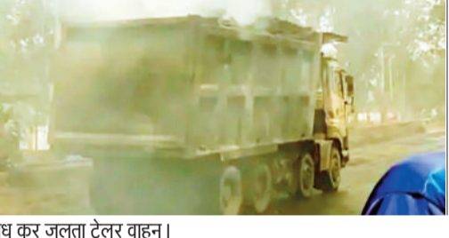
धुंघू कर जलता ट्रेलर वाहन।

ट्रेलर से धुआं निकलता देख राहगीरों ने वाहन चालक को रोकने का प्रयास किया। तेज रफ्तार के कारण वाहन काफी दूर जाकर रुका। चालक को आग की जानकारी मिलते ही उसने कंपनी को सूचित किया। मौके पर पानी टैंकर बुलाकर आग पर काबू पाया गया। यह पहली घटना नहीं