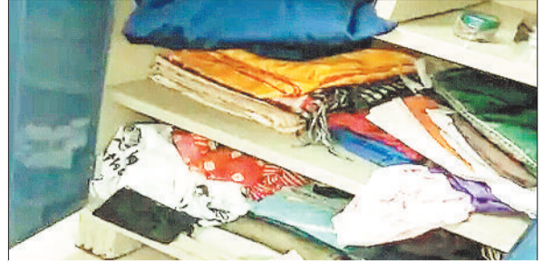
आलमारी जहां चोरों ने वारदात को दिया अंजाम।