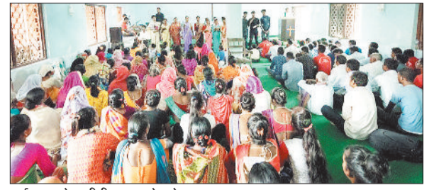
प्रार्थना करते मसीही समाज के लोग।