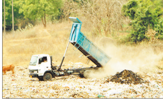
मंगला में किया जा रहा कचरा डंप, गंदगी और बदबू से बीमारी फैलने की आशंका। मंगला में निगम की खाली पड़ी जमीन पर मृत मवेशियों को किया जा रहा दफन।

हालांकि निगम का कहना है कि मंगला में निगम की 25 एकड़ जमीन पर इन्हें दफनाने के साथ ही उपर से मिट्टी डाली जाती है, जिससे बदबू ना फैले। निगम का कहना है कि कुत्ते और छोटे जानवरों को लायंस कंपनी ले जा कर दफनाती है तो बड़े मवेशियों के लिए अलग से दूसरी कंपनी को काम दिया गया है, जिसे प्रति महीना एक लाख का भुगतान किया जाता है। यह एजेंसी